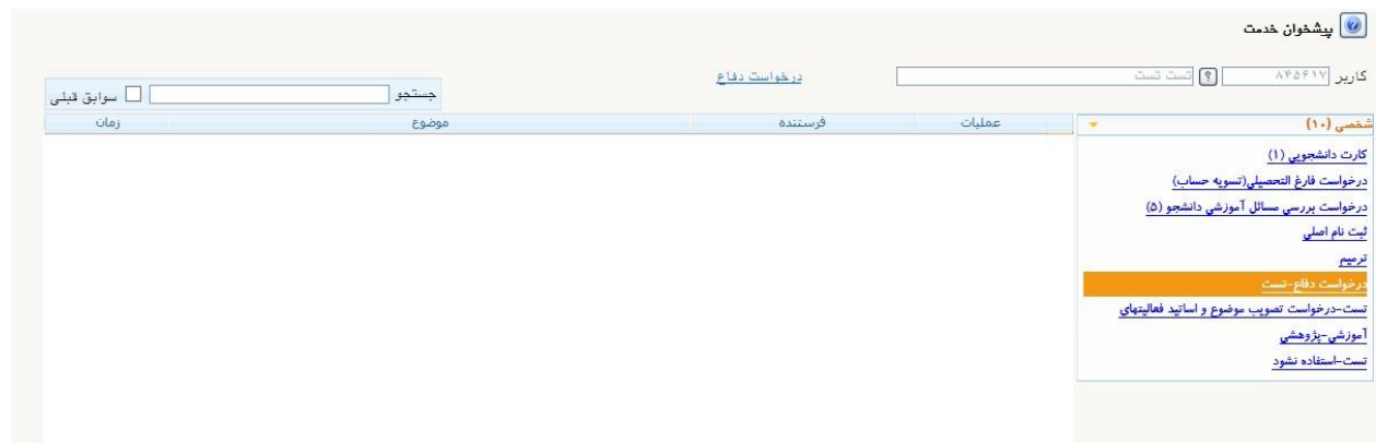
شکل ۲- پیشخوان خدمت سامانه جامع آموزش، انتخاب گزینه درخواست دفاع